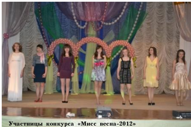
Участницы конкурса «Мисс весна-2012»

Поскольку в этом году Учредителем Конкурса выступила Администрация ГО, то и статус мероприятия стал совсем иным. Это чувствовалось и по настроению зрителей, и по общей атмосфере праздника, и по уровню подготовки участниц. Семь претенденток на почетное звание показали достойные выступления.